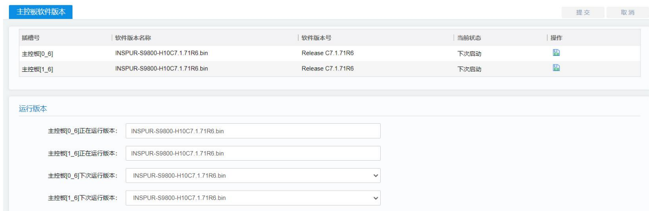
图 2 软件版本升级页面

路径：【MAIN】→【系统管理】→【软件版本】→【主控板软件版本】→【浏览】，如下图所示：